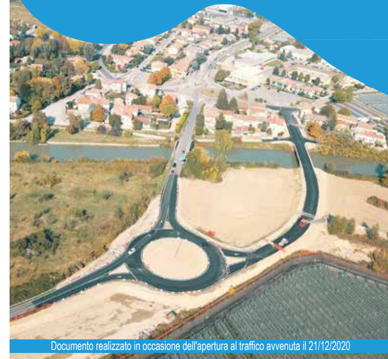
Documento realizzato in occasione dell'apertura al traffico avvenuta il 21/12/2020

LOTTO 2 STRALCIO 1 / PARTE FINAL DI RERO Realizzazione ponte provvisorio e dell'annessa viabilità di via della Pace a Final di Rero