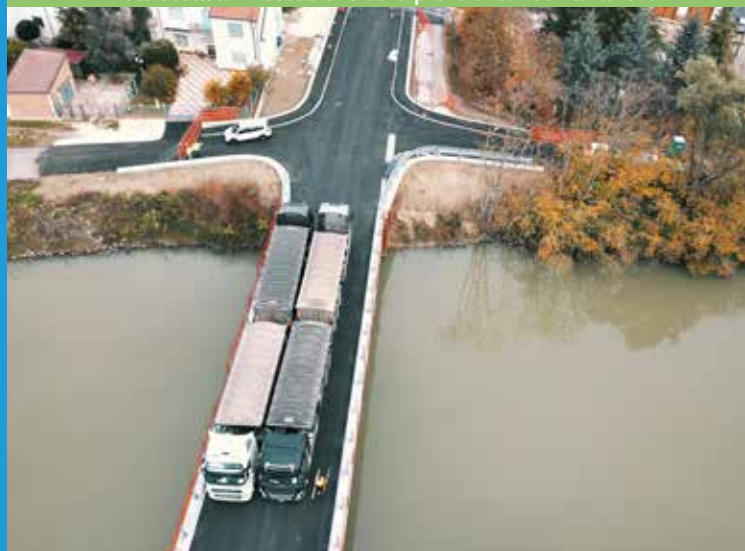
Foto scattata in occasione della prova di carico 18/10/2020

Quest'ultimo offre vantaggi di vario tipo a partire da quelli ambientali. Una chiatte, ad esempio, da 1350 tonnellate (pari a 50 TIR) può percorrere 100 km con un litro di gasolio, mentre un TIR si ferma dopo 10.