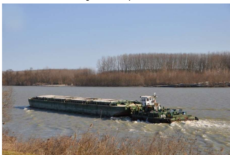
Figura 232 Convoglio chiatta-spintore in Po

Il porto di Mantova, con annessi attracchi industriali, si conferma come una delle poche realtà in grado di valorizzare ed utilizzare le vie d'acqua interne, favorita anche da condizioni storiche, insediamenti industriali e da una posizione logistica favorevole all'interno della rete idroviaria (collegata al Po ed al Fissero-Tartaro-Canalbionco) che consente di superare le difficoltà imposte dai periodi di magra.