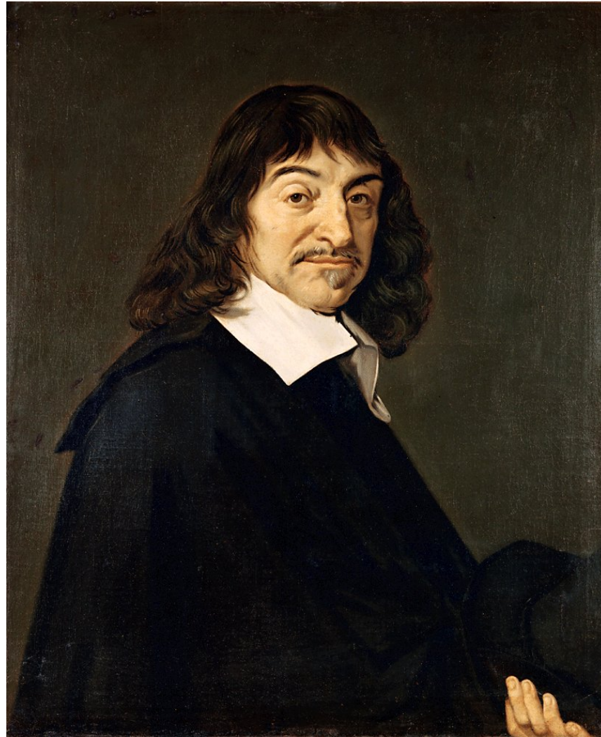
Frans Hals: Cartesio nel 1649