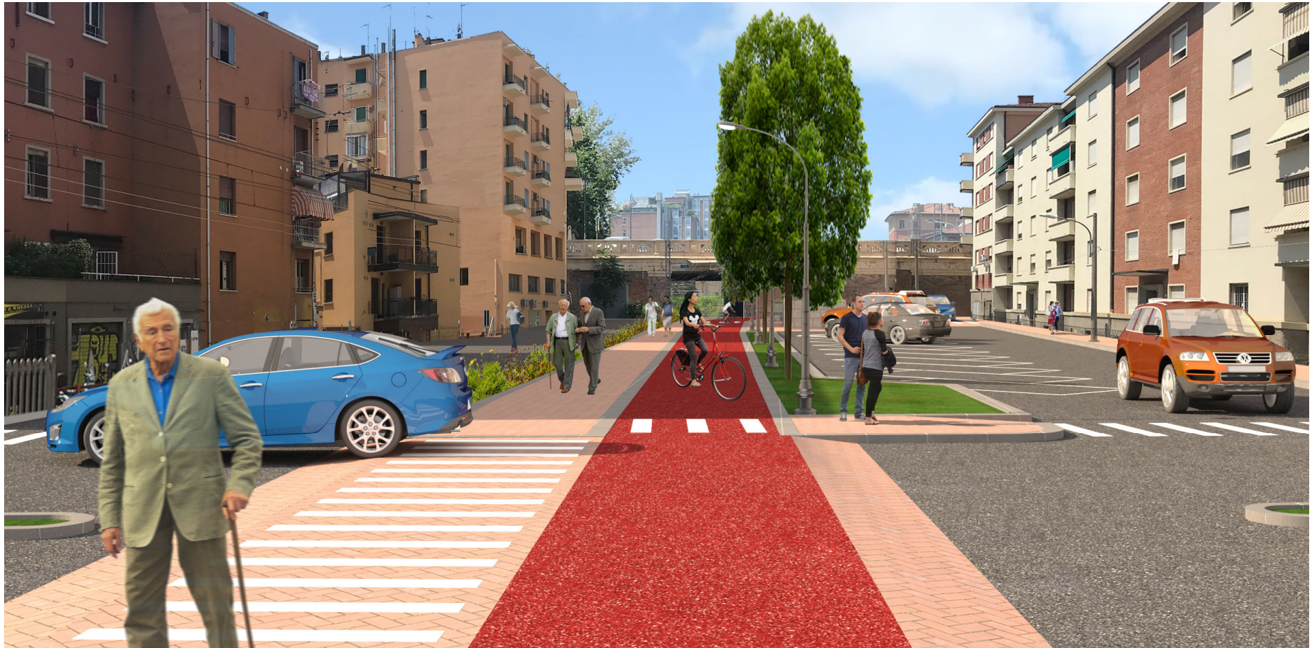
Figura 1 – Incrocio via Libia