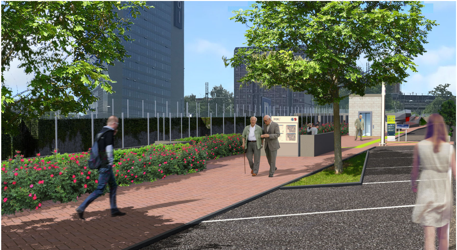
Figura 10 – Fermata Via Larga, accessi su via Scandellara