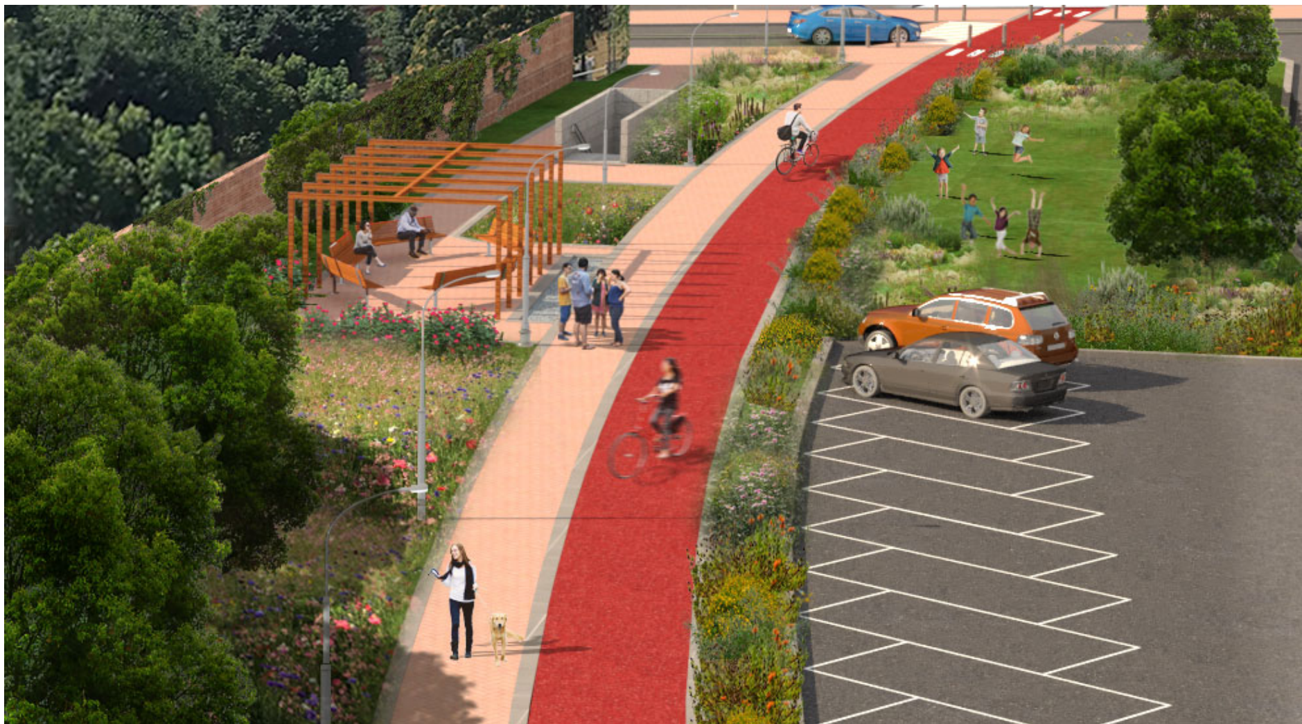
Figura 4 – Area di aggregazione ed uscita di emergenza, via Bentivogli/via Fabbri