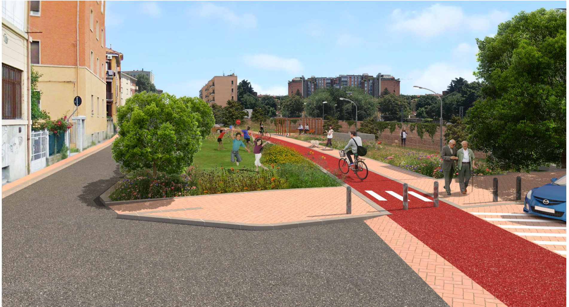
Figura 3 – Via Paolo Fabbri