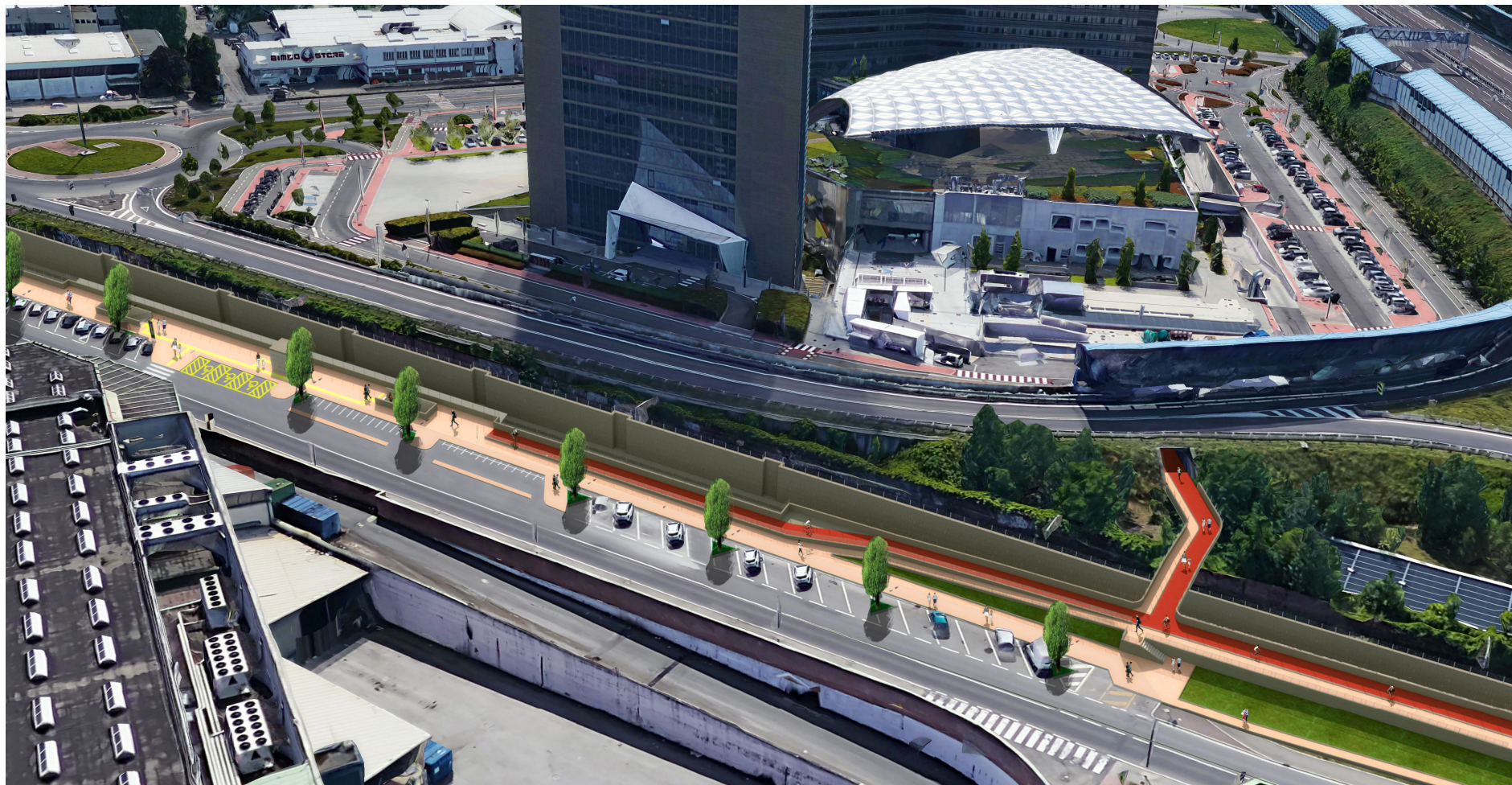
Figura 9 – Fermata Via Larga, vista aerea su via Scandellara