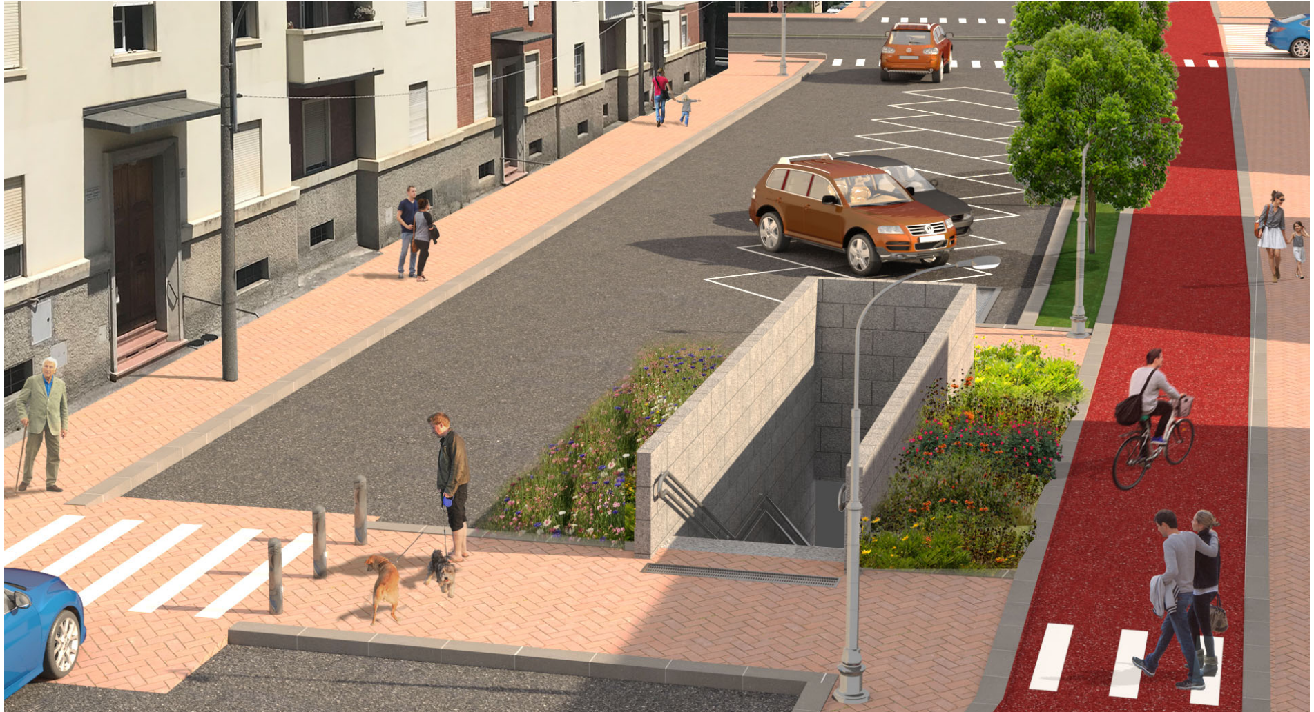
Figura 2 – Via Libia, accesso all'area tecnica sotterranea