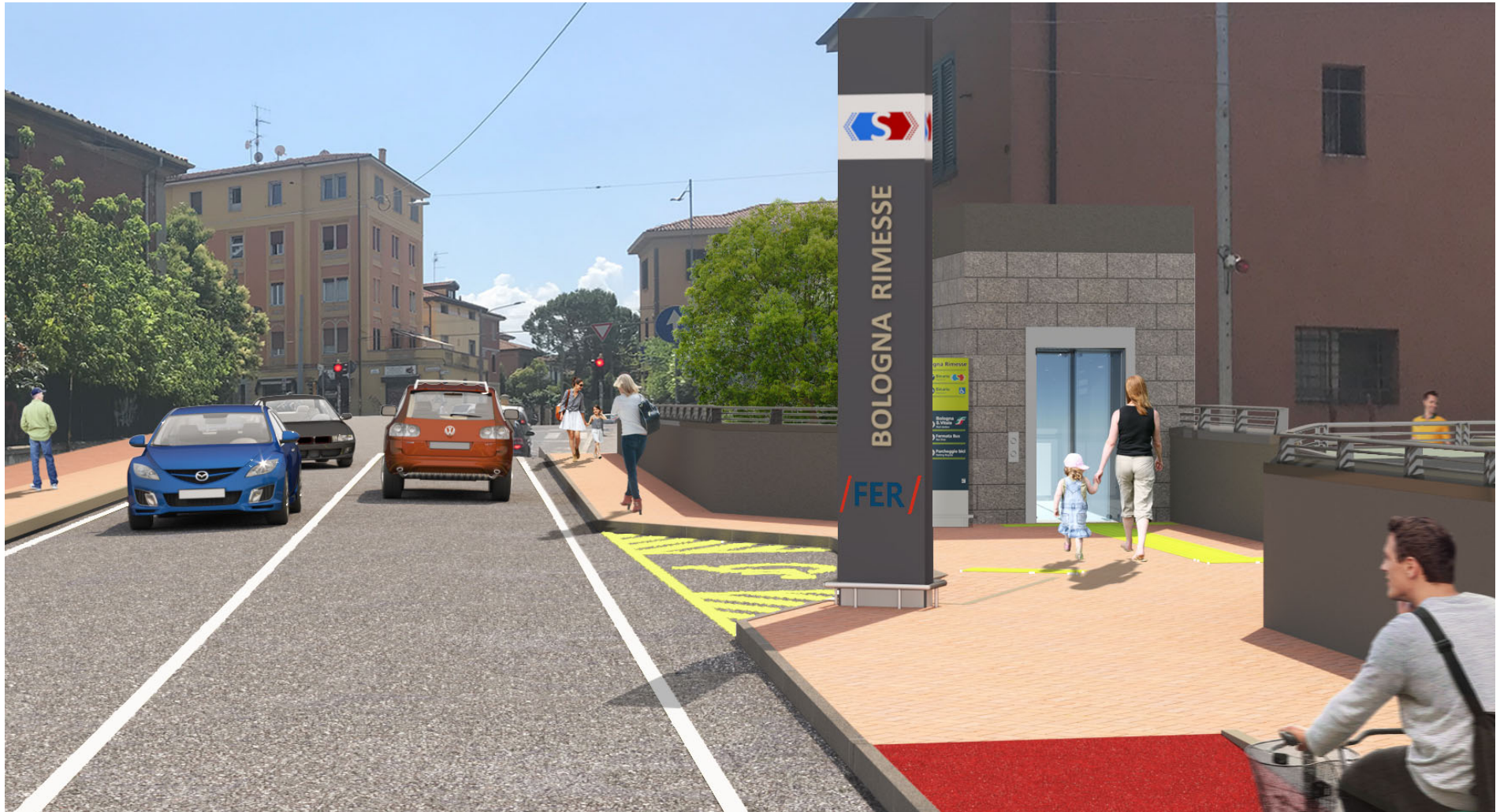
Figura 6 – Fermata Via Rimesse, ingresso sul cavalcaferrovia di via Rimesse