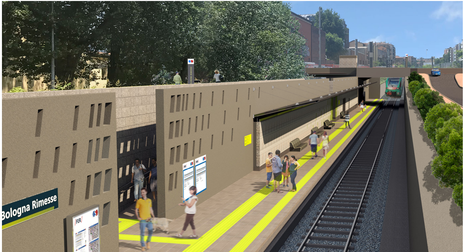
Figura 8 – Fermata Via Rimesse, marciapiede