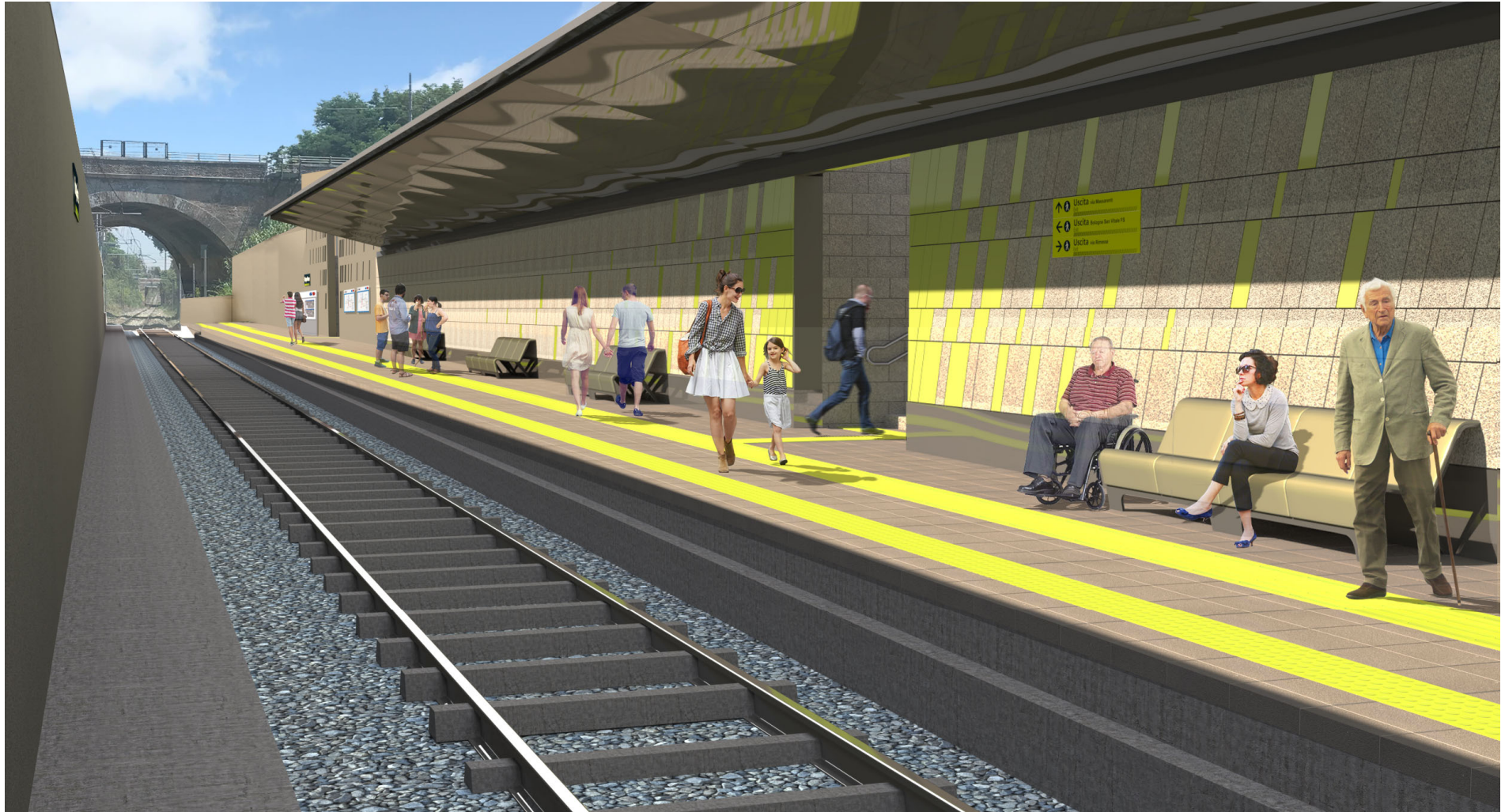
Figura 7 – Fermata Via Rimesse, marciapiede