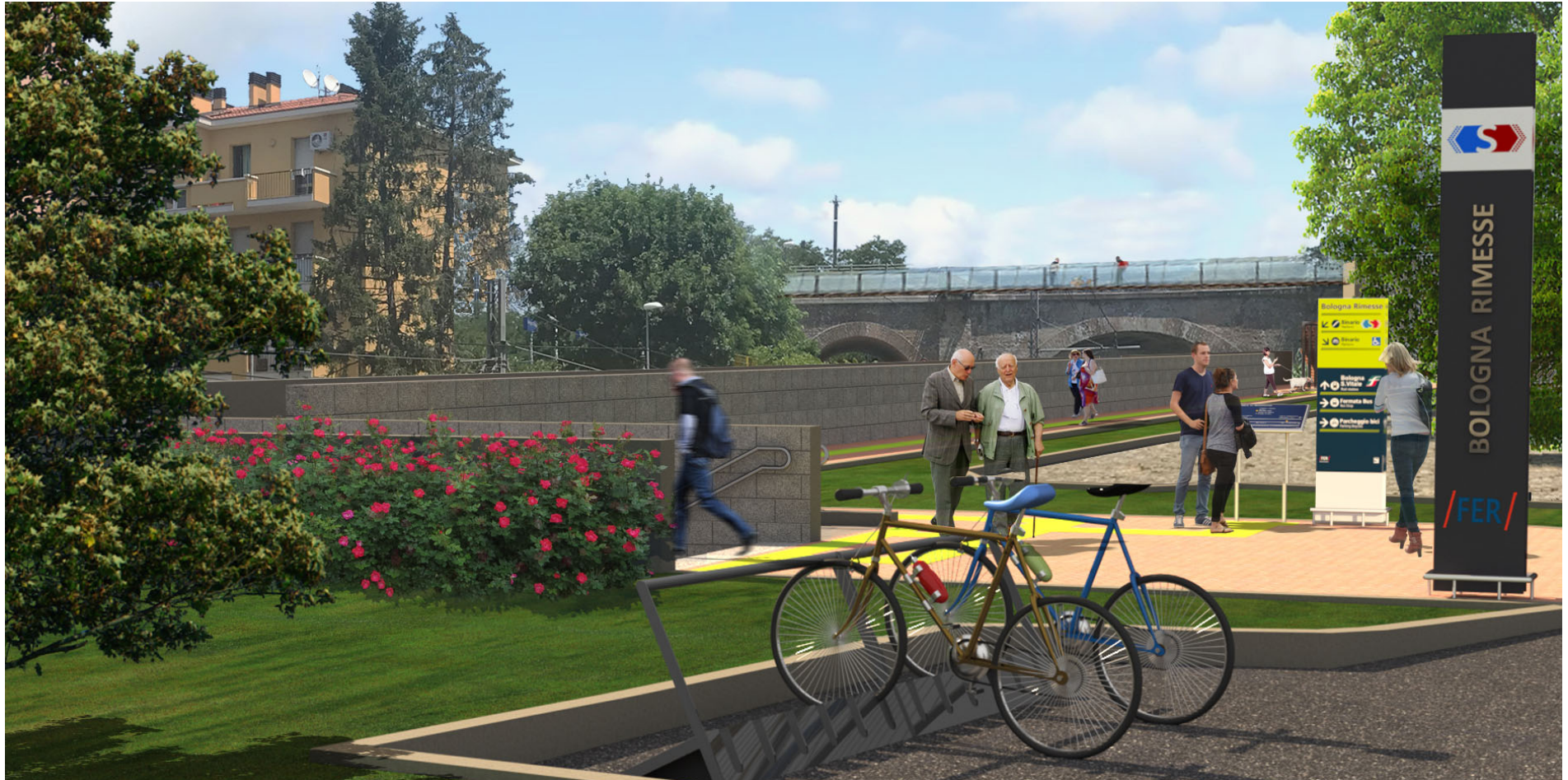
Figura 5 – Fermata Via Rimesse, accesso dal parco, lato via Massarenti