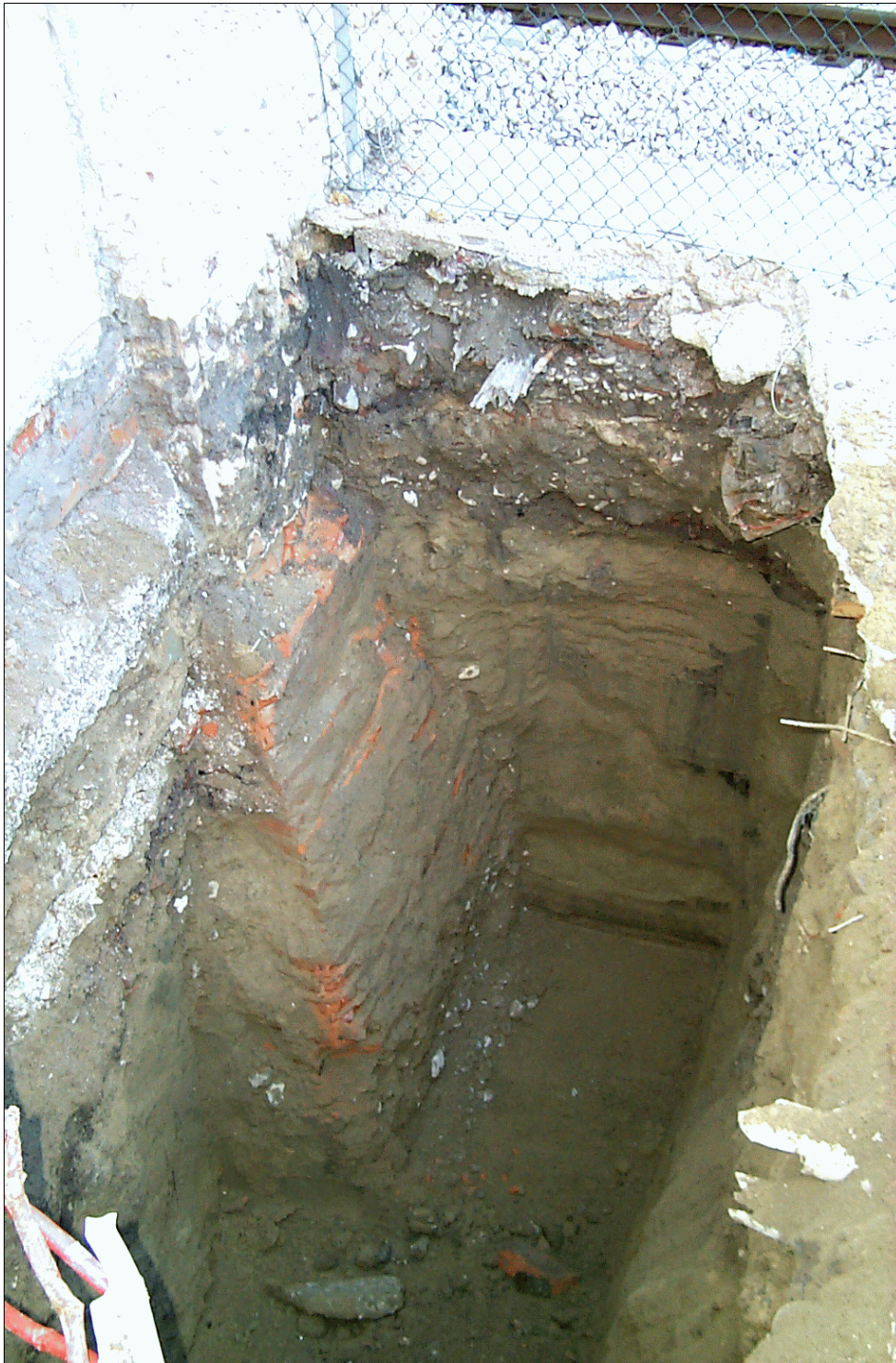
FOTO 23: Fondazione spalla nord del cavalcaferrovia di V.Bentivoglio