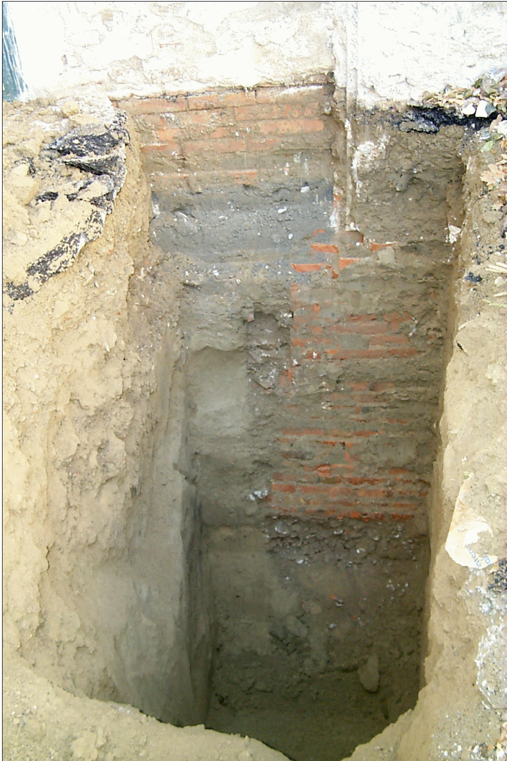
FOTO 25: Fondazione spalla sud del cavalcaferrovia Via Bentivogli.