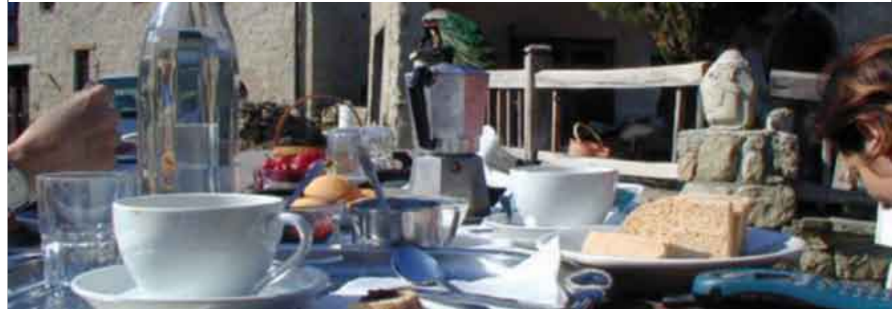
Foto della vista d'insieme della struttura. Invio.

Ampio cortile, cuore della fattoria, sempre affollato da capre, polli, conigli, pavoni, oche, anatre ... che periodicamente ... vengono utilizzati anche in cucina. Di fianco un laghetto.